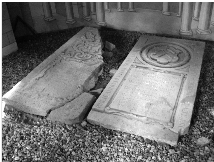
Interiér slobodomurárskeho pavilónu v parku kaštieľa Betliar