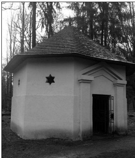
Slobodomurársky pavilón v parku kaštieľa Betliar